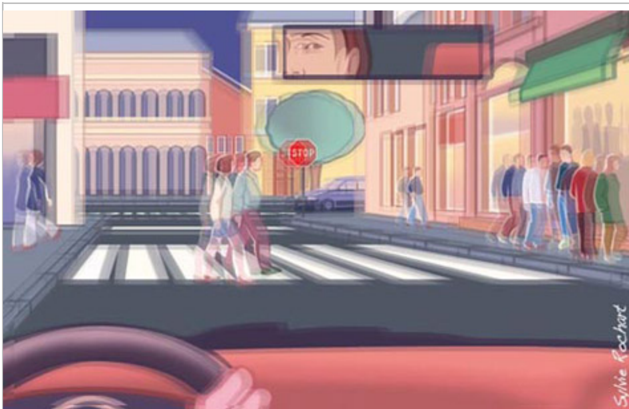
Astigmate : vous distinguez mal certaines formes de près comme de loin

L'astigmatisme se traduit par une vision imprécise et floue, quelle que soit la distance à laquelle se situe l'objet regardé. Ainsi, il est difficile de distinguer certains signes ou formes proches, comme le H et le N ou le 8 et le 0.