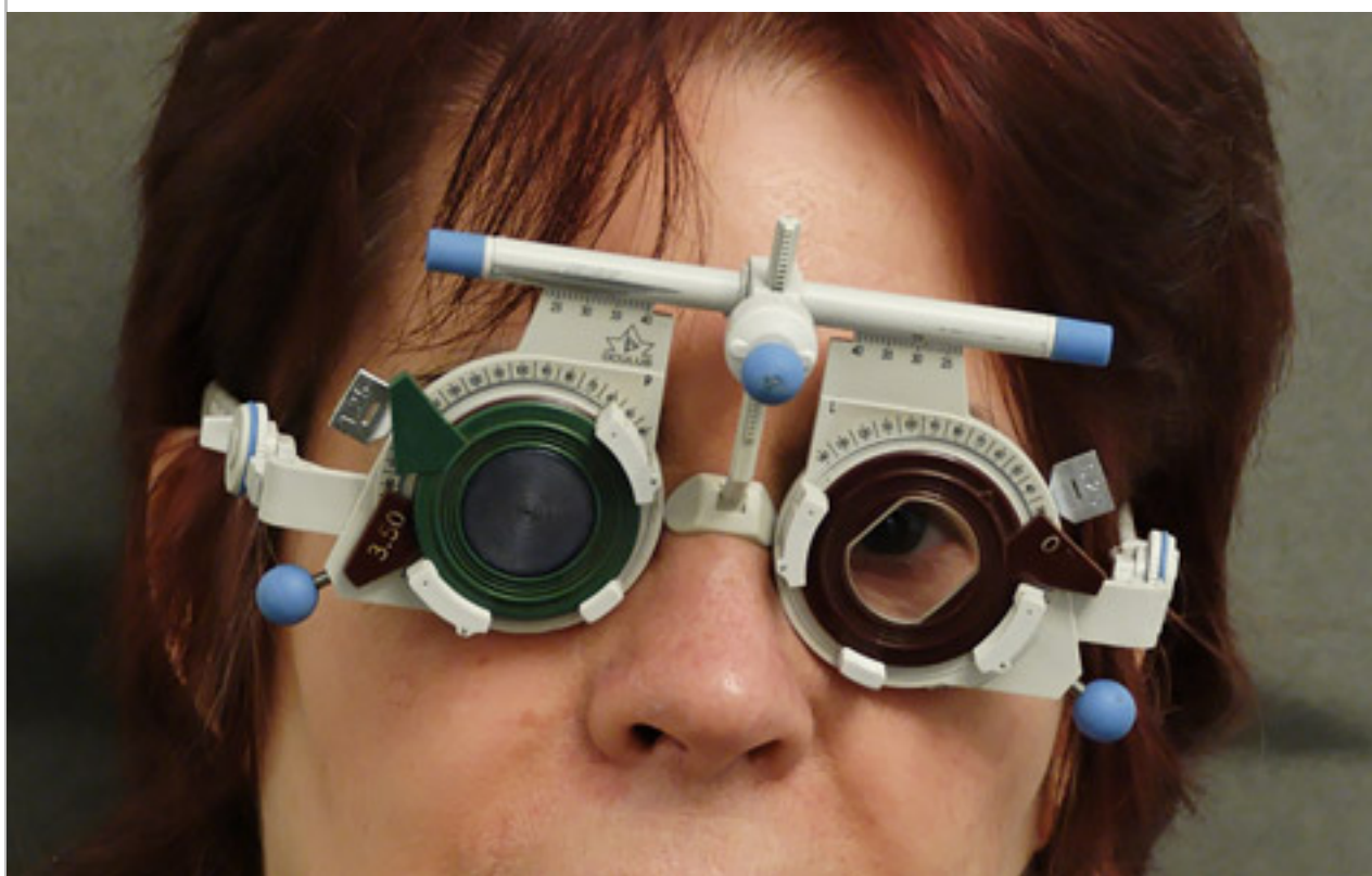
La correction de votre astigmatie est établie avec des lunettes d'essai

Il est possible d'évaluer l'importance de votre trouble de la vision à la fois en évaluant votre acuité visuelle et en déterminant la correction nécessaire pour revenir à une vision normale.